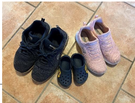
Skoene tilhører den lille familie og foto er delt med deres tilladelse.

Da sønnen var kommet i vuggestue og mor havde fået det bedre, afsluttede vi forløbet i HOME-START.