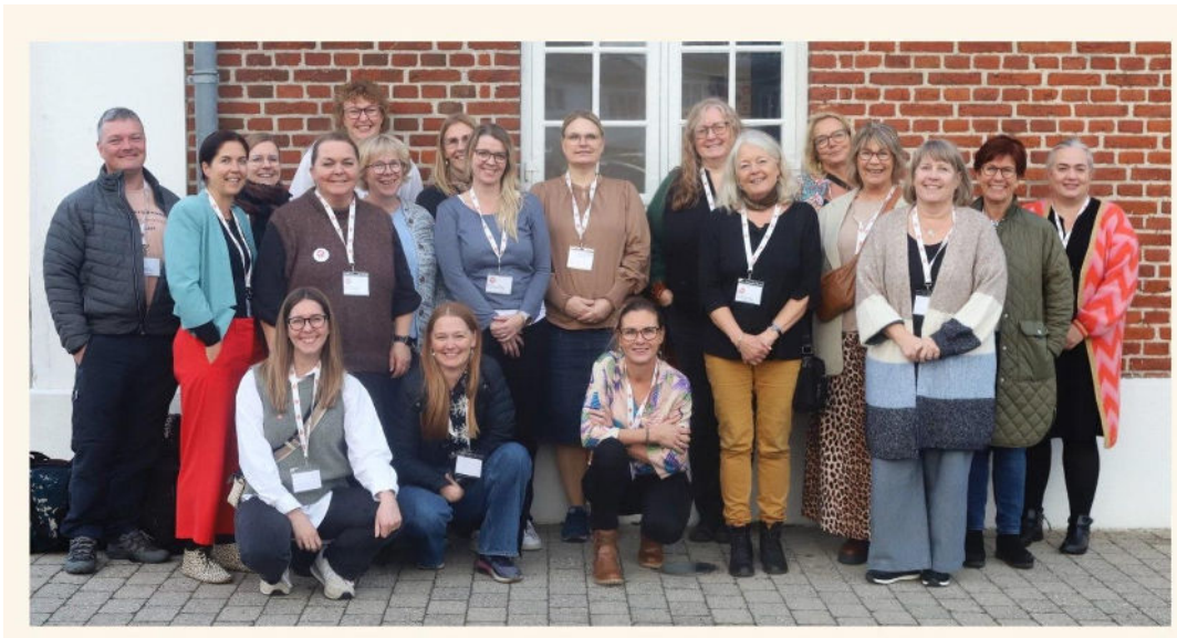
Koordinatorer samlet til seminar i Middelfart

Oversigt over HOME-STARTs lokalafdelinger kan findes her: Afdelinger - HOME-START