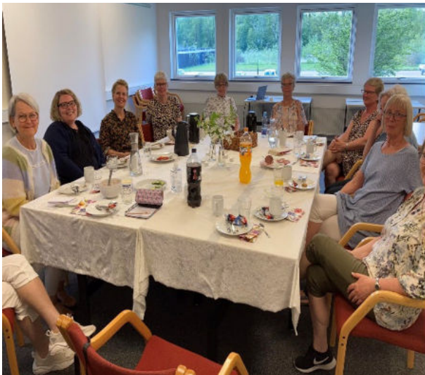
Frivillig cafe hvor sundhedsplejersker, der står for gruppeforløb for mødre med efterfødselsreaktion, fortalte om deres fine tilbud.