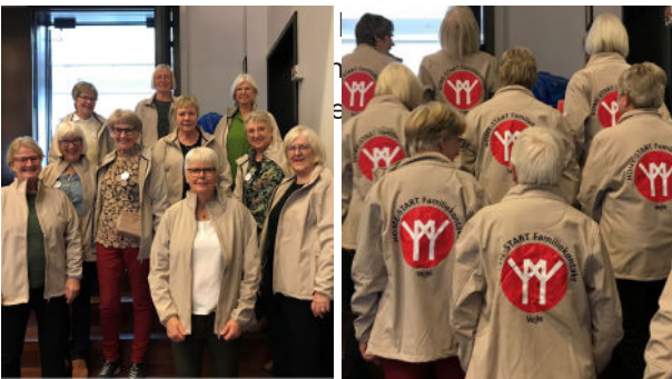
Familievennerne har i år fået en jakke med logo på ryggen. Det var et ønske fra Walkers-medlemmerne, som vi valgte at følge med tilbuddet om en jakke til alle familievenner.

Nye familievenner tilbydes medlemskab af gruppen, så de hurtigt får en oplevelse af at være velkommen og tilbud om at deltage i fællesskab.