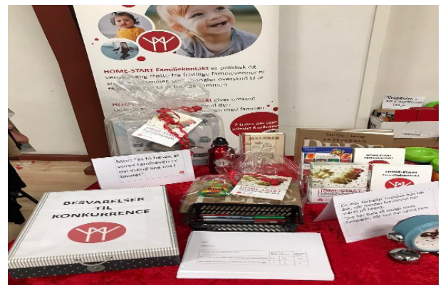
Et eksempel på PR-bord

Det giver gode snakke og positive tilkendegivelser om, at vi findes, og at der er brug for os.