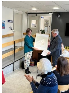
HOME-START Hjørrings reception i anledning af 5 års-fødselsdagen