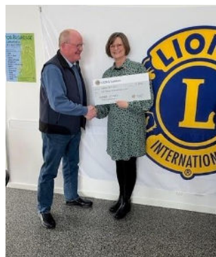
Overrækkelse af donationer fra Ladies Circle og LC Løkken