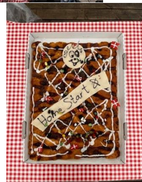
Stemningsbilleder fra familiearrangementet i FUN PARK Hirtshals.

D. 16. december havde vi med familierne og familievennerne endnu en skøn oplevelse sammen. På Vendelbohus, hvor Hjørring Sommerspil viste familieforestillingen 'Pippi Langstrømpe fejrer jul', fik vi billetter til en favorabel pris og 90 forventningsfulde børn, forældre og familievenner mødte op for at komme i julestemning 🎄 Flere fik en oplevelse for livet, idet nogle af familierne aldrig før havde været i teater!