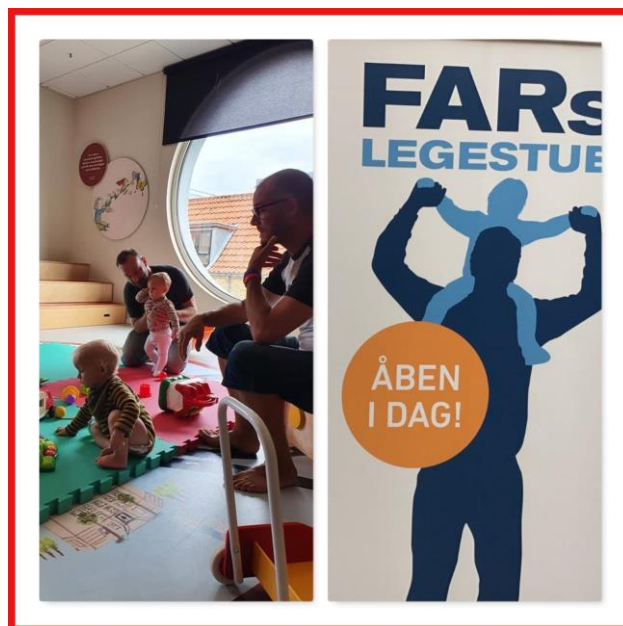
Fars legestue hver tirsdag.

I Holbæk er vi sammen med mødrehjælpen værter for Fars Legestue på Holbæk Bibliotek hver tirsdag