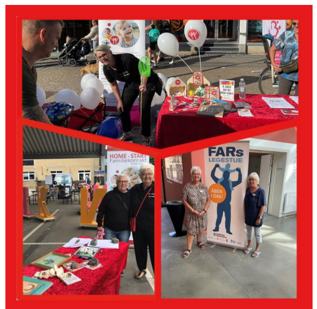
De fantastiske frivillige familievenner

De fleste kommer to timer om ugen i en småbørnsfamilie, men mange hjælper også med børnepasning i sundhedshusene i forbindelse med terapiforløb for mødre med efterfødselsreaktion. De hjælper med at fortælle om HOME-START Familiekontakt – ved arrangementer og folkemøder eller de er bogorme og værter ved fars Legestue. Vi gør, hvad vi kan, for at se og anerkende dem. Den ro de bringer ind i familien, den omsorg de deler ud af og det hverdagshåb de spreder. Magien opstår i mødet mellem dem og familien – i det mellem menneskelige rum. De frivillige er fantastiske ambassadører for vores organisation.