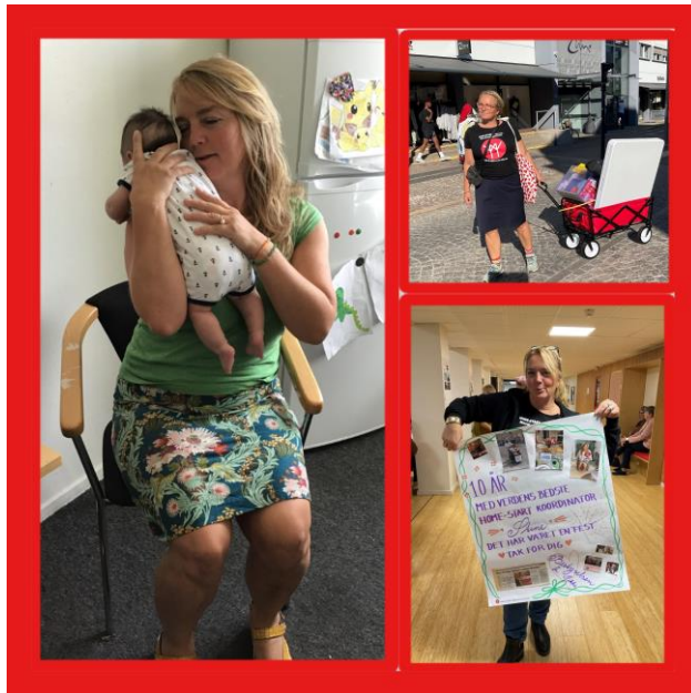
10 år Mulle, så ved man altså et eller andet

D. 1.oktober 2022 havde jeg 10års jubilæum i HOME-START Familiekontakt Nordvestsjælland.