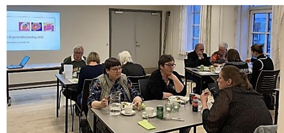
HOME-STARTs 1. generalforsamling blev afholdt på Ikast Bibliotek