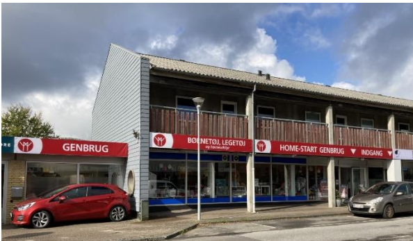
HOME-START Genbrug er flyttet til Møllegade 18a i Ikast

Butikken i Danmarksgade var ligesom alt andet ramt af nedlukning i starten af 2021, og i den periode gik nogle af de frivillige i butikken gik i gang med et kæmpe projekt, nemlig at rydde op og rydde ud i kælderen for at gøre klar til flytning. Samtidig brugte frivillige, koordinator, venner og bekendte uendelig mange timer på at komme til bunds med rengøring, renovering og maling af de nye lokaler.