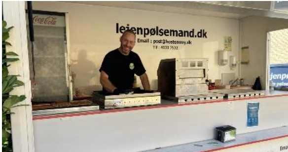
Den 9. september fejrede alle dem, der havde hjulpet med renovering, familievenner, frivillige og bestyrelse de nye lokaler med tid til snak og hygge - og alle de hotdogs man kunne spise.

Fællesskabet i butikken har stor betydning. Hver enkelt frivillig og praktikant bidrager med deres personlighed, evner og energi. Fællesskabet er præget af omsorg, respekt for forskelligheder, plads til sjov og alvor – og med mulighed for nye venskaber.