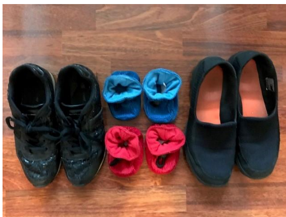
Foto af familiens sko