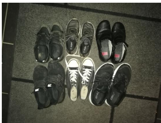
Foto af familiens sko