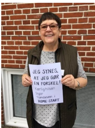
Inger har været familieven siden 2017. Foto blev brugt i et opslag med familievenner fra hele landet på Facebook

I 2020 har 16 nye familievenner været på forberedelseskursus fordelt på 4 hold. Siden afdelingens start i 2013, har der ikke været så mange nye på et år. Det er en kæmpe