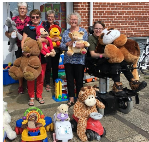
I anledning af fødselsdagen stillede nogle af de frivillige op til festligt fotoshoot, som kom i Ikast Avis sammen med en pressemeddelelse.