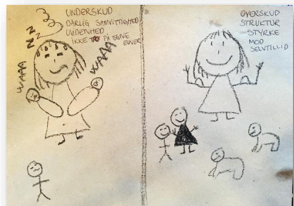
Mors tegning. Til venstre: da familien tog kontakt til HOME-START. Mor har stået meget alene med de tre børn, når far har været på arbejde. Til højre: ved afslutning af forløbet. Familievennen med den sorte kjole er sammen med ældste barn. Mor har fået store muskler! Delt med forældrenes tilladelse.

Ved afslutningen, hvor familien, familievennen og HOME-STARTs lokale koordinator sidder omkring kaffebordet, fortæller forældrene, at der nu er kommet struktur og ro på hverdagene, tvillingerne trives og storebror har vænnet sig til at være storebror. Familien har flere gange været i LEGOLAND med alle tre børn – et tegn på, at det nu er ro, overskud, tryghed, mod og selvtillid, der præger familien.