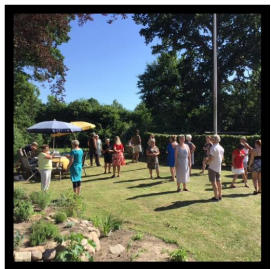
En lille velkomst samtale med afstand og sol

Det blev med sprit og afstand, men vejret og den fantastiske stemning var heldigvis med os