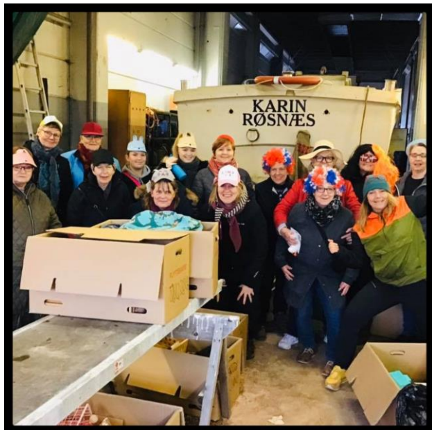
Til frivilligcafe og gavekasse sortering i Kalundborg – lige inden Coronaen ramte. Da vi stadig måtte stå tæt.