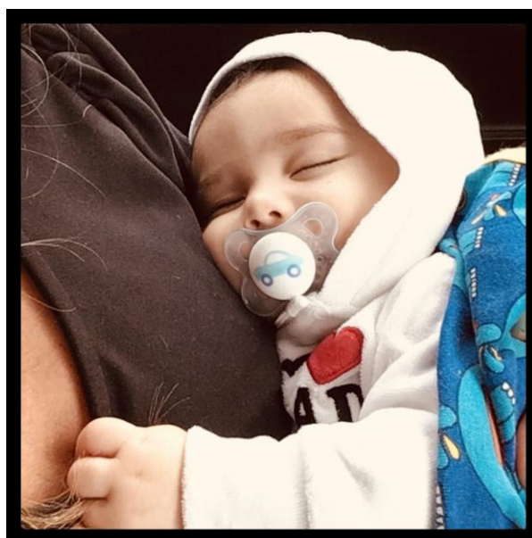
Billede taget på familiebesøg lige efter sommerferie da vi endelig måtte holde børn igen <3

De frivillige børnepassere får meget ros af sundhedsplejerskerne og mødrene er trygge ved at overlade deres børn til dem.